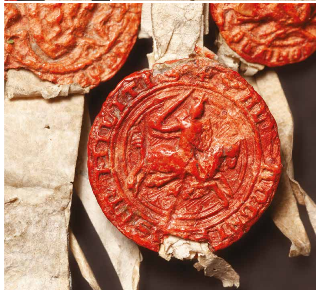
Deiseil bho shuas: Gairm Obar Bhrothaig, Seula Alasdair Lambertson, teasca 'cho fada is a sheasas ceud againn beò', Seula Alasdair Fhriseil

Habens aut Josue labores + cedis in Consensus + assensus nrm fecit Istet Regi Anglorum + Anglias Omnia q' dnu. Caru. vniu. raudise Tenende p'it + dno q' sacra. com. + Scoti + Anglia. + bulaciones. ib; yonere + exhortari dignemur